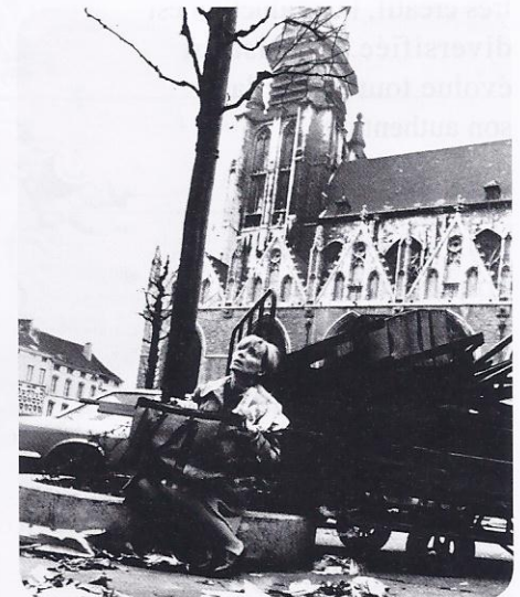
Annie Cordy dans le film Rue Haute dont l'action se situe places de la Chapelle et du Jeu de balle, rue Haute et aussi au Sablon.