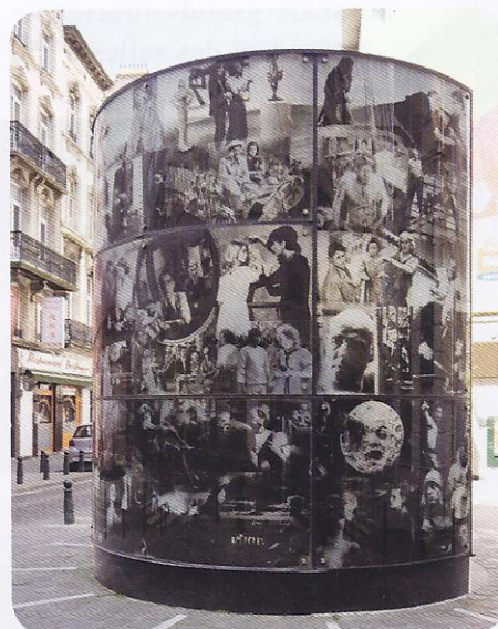
Le monument dédié à Joseph Plateau, dans la rue du même nom à Bruxelles.