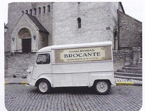
Une photo d'un épisode de Louis la brocante , tourné en avril 2011 à 1200 Woluwe St Lambert. L'action est censée se dérouler à Bruges...

Bruxelles fait son cinéma , 128 pages, chez 180° éditions, 19 €. Disponible dans toutes bonnes librairies. 0471/97 30 84 et www.180editions.com